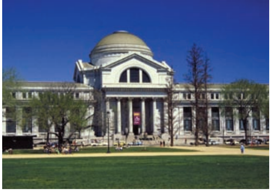
Smithsonian Enstitüsü Ulusal Doğa Tarihi Müzesi

Müzelerin amacı, tarihin eski dönemlerinde yaşamış bulunan medeniyetleri bilim ve sanat açısından inceleyerek, hem günümüze, hem de geleceği aydınlatmaktır. Ayrıca müzelerde sergilenen geçmişe ait eserlerle, ülkelerin ulusal değerlerinin oluşmasına önemli katkıda bulunurlar ve aynı zamanda etkin katılım ve kalıcı öğrenmeyi sağlayan eğitim kurumlarıdır.