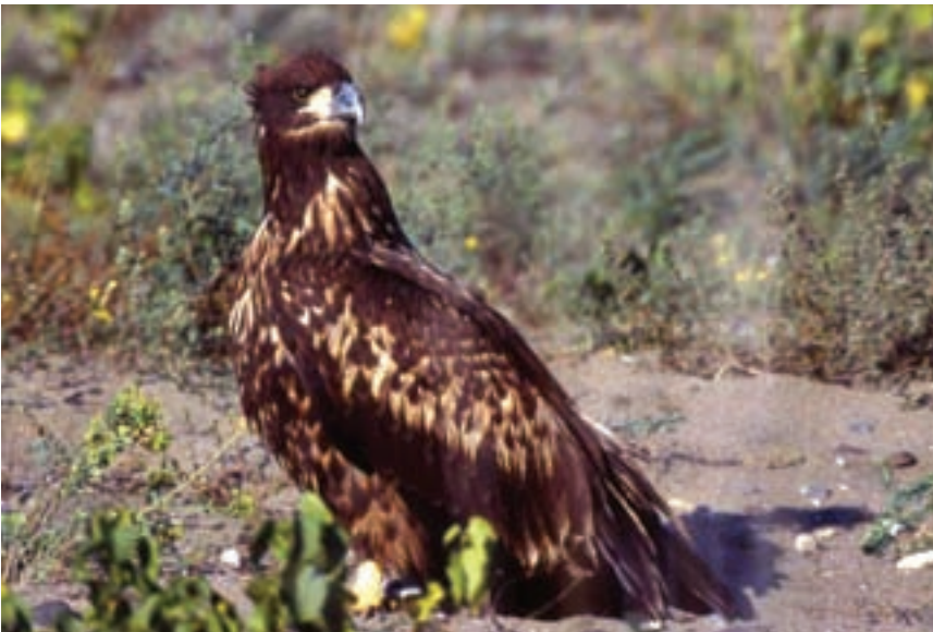
Akkuyruklu kartal ( Heliaeetus albicilla )

Kızılırmak Deltası bulunduğu bio-coğrafik bölge açısından, Batı palaerktik bölge içerisinde yer almaktadır. Bu bölge; Ural Dağları'ndan başlayarak Türkiye-İran sınırını takip ederek tüm Orta-doğu ve Arabistan yarımadasının bir kısmını, Kuzey Afrika'nın tamamını ve Kanarya Adaları dahil olmak üzere tüm Avrupa ve Faroe adalarıyla birlikte çok büyük bir alanı kapsamaktadır. Bu bölgede yaklaşık olarak 1100 kuş türü tespit edilmiştir. Türkiye'de ise 450 kuş türü tespit edilirken, yalnızca Kızılırmak Deltası'nda bu zamana kadar 323 kuş türü tespit edilmiştir. Bu kuş türlerinde yaklaşık olarak 140 türü deltada ürerken, dünyada nesli tehlike altında olan 24 tür yine Kızılırmak Deltası'nda yaşıyor. Özellikle kış dönemlerinde Kızılırmak Deltası'nda 100.000 kuşun kışladığı tespit edilirken, yalnızca bu kriter bile ala-