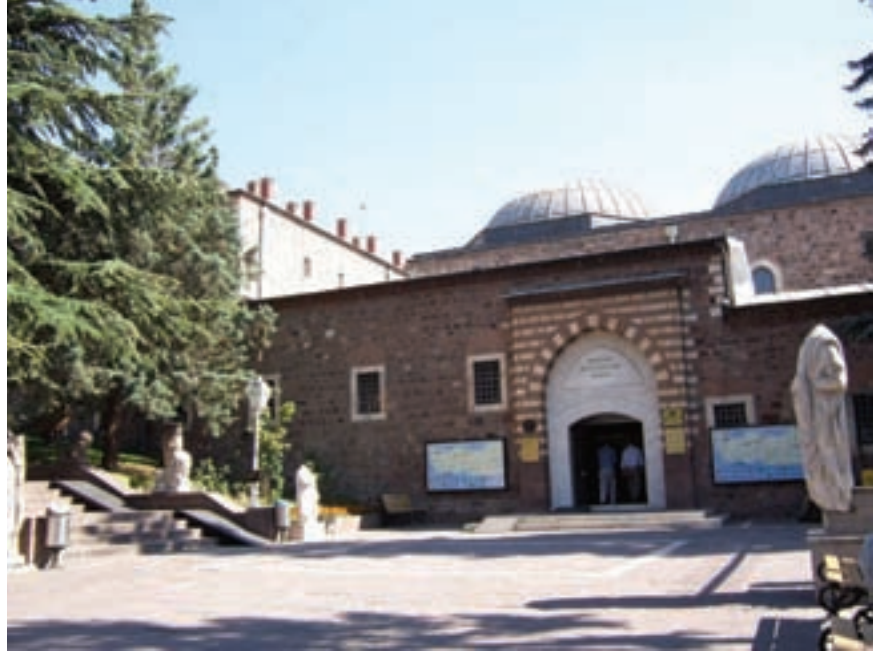
Ankara Anadolu Medeniyetleri Müzesi

Günümüzde müzeler bir değişim sürecine girmiştir. Artık önemli olan bilginin geniş kapsamıyla kullanılması. Buna göre müzeleri üç sınıfa ayırabiliriz. Bunlar nesne odaklı, nesne odaklı bilgiye yönelen ve bilgi odaklı olup nesneye yönelen müzeler. Nesne odaklı müzeler, 15. yüzyılda başlayan koleksiyonculuk geleneğinin bir uzantısı. Burada yalnızca nesnelere depolanır, etiketlenir ve göstermek dışında bir başka amacı da yoktur. Bilgi yalnızca biriktirilir ve dağıtım işlemi yapılmaz. Dolayısıyla bilginin dağıtılması kısıtlıdır, nesneye odaklıdır ve müzenin eğitim aracı olarak kullanılmasından uzaktır.