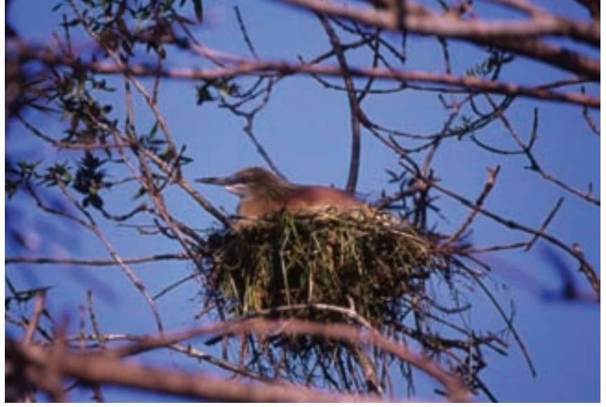
Alaca balıkçıl yuvada ( Ardeola ralloides )

na “Dünya Ölçeğinde Korunması Gereken Alan Statüsü” verilmesini sağlamakta.